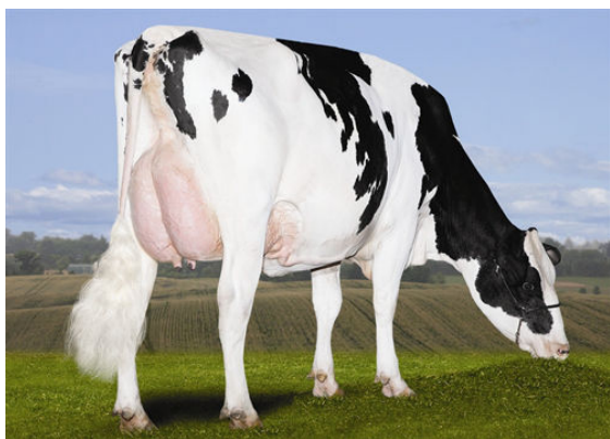
BEAUSTYLE SUPERPOWER SUPERFINE

Left to Right DONSHER LEVANNA SUPERPOWER, CRITESDALE SUPERPOWER 680, SILVEROAK SUPERPOWER ANNABELLE