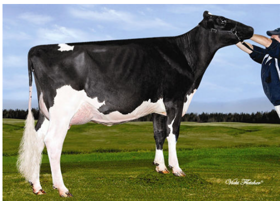
TWINHILL SUPERPOWER DIAMOND